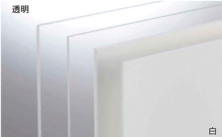
光の反射により現物と差異がございます。現物をご覧ください。