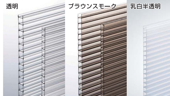
光の反射により現物と差異がございます。現物をご覧ください。