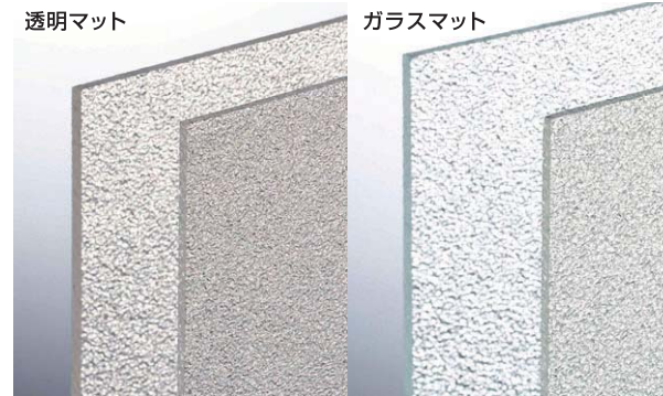
光の反射により現物と差異がございます。現物をご覧ください。